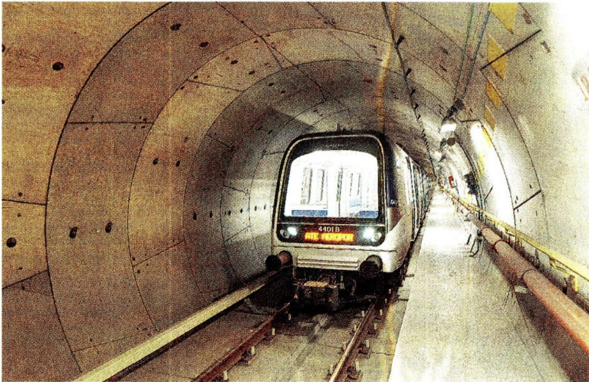
M4 Milano. La stazione di Linate Aeroporto