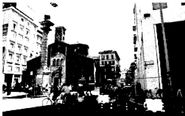
LA PIAZZA Iniziano oggi i cantieri per realizzare la stazione M4