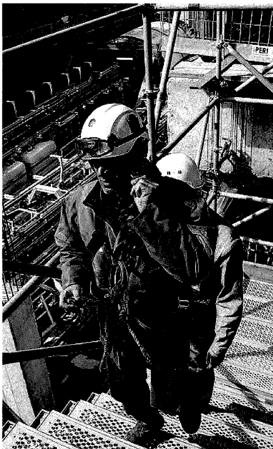
LAVORI IN CORSO Cambia parzialmente il piano di intervento per la realizzazione della nuova linea 4 della metropolitana

LUNGO la prima e la terza tratta, quelle più periferiche, lavorano e lavoreranno due escavatrici