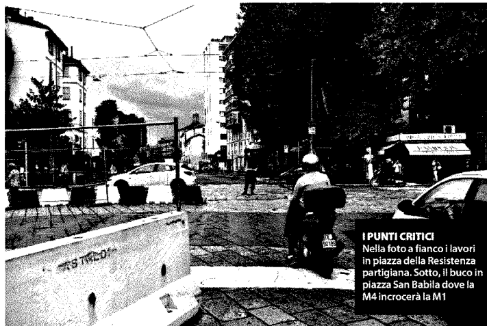
I PUNTI CRITICI Nella foto a fianco i lavori in piazza della Resistenza partigiana. Sotto, il buco in piazza San Babila dove la M4 incrocerà la M1

nanze per la riapertura al traffico di via Luini verso corso Magenta con il riposizionamento del semaforo, decongestionando così via Nirone. Tempi previsti, tre o quattro settimane. Avviati anche i provvedimenti per dare diritto di accesso alle moto alla Ztl di via Mazzini in entrambe le direzioni a seguito della chiusura di piazza San Babila, come già previsto da una delibera del Consiglio del Municipio 1. Per quest'ultima apertura i tempi previsti sono di quindici giorni.